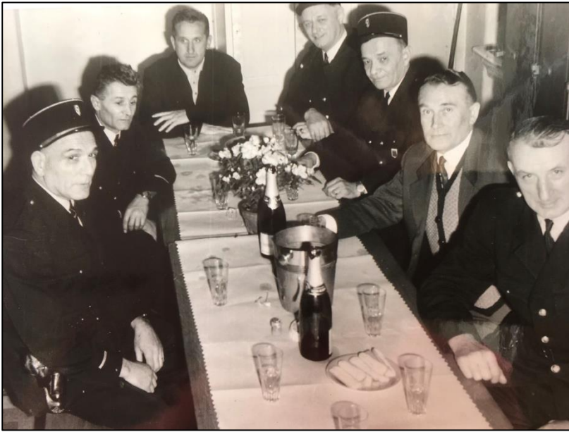
Photos souvenirs aimablement communiquées par sa fille Nicole Mourachoff .