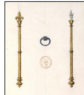
Sceptre et main de justice

Sceptre, main de justice, couronne, globe terrestre ont été les regalia des rois et empereurs de toutes les nations.