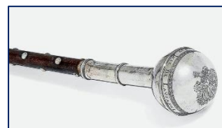
Canne Berne (Wikipedia)

A l'étranger, tel à Berne, la canne était le symbole du pouvoir judiciaire. A Genève, l'agent était porteur d'une canne noire à pommeau blanc. A Tournai, en 1783, une compagnie de 42 hommes divisée en trois brigades remplaçât tout à la fois les « sergents bâtonniers », les commis, les cavaliers de maréchaussée les crieurs de nuit et les guetteurs. 11